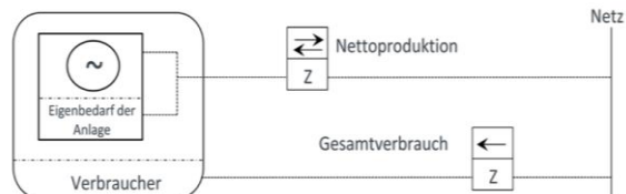
Messanordnung A: Separate Messung von Produktion und Verbrauch

Diese Preise sind gültig für die Lieferperiode 01. Januar 2022 bis 31. Dezember 2022.